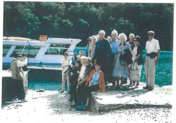
Voyage des aînés ruraux dans l'Aveyron

De nombreuses voitures de prestiges et de collection aux journées MJC.