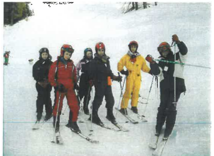
Séjour de ski dans les Alpes pour les jeunes de l'intercommunalité