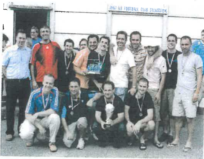
Une équipe de foot où règne la bonne humeur.