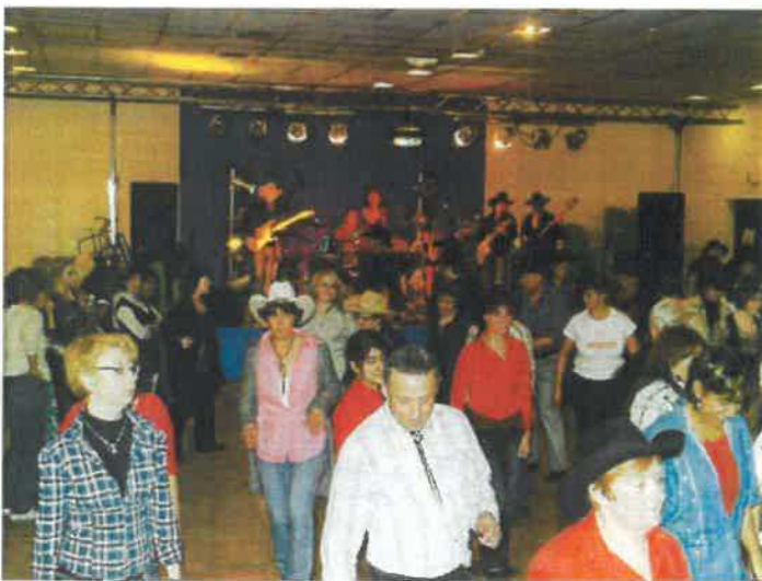
Soirée country du 7 mars