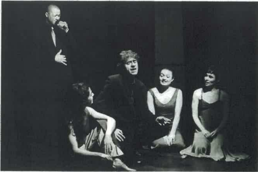
« les voix liées » ont chanté Nougaro le temps d'une soirée à Valdurenque