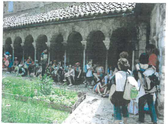
Sortie scolaire à Albi