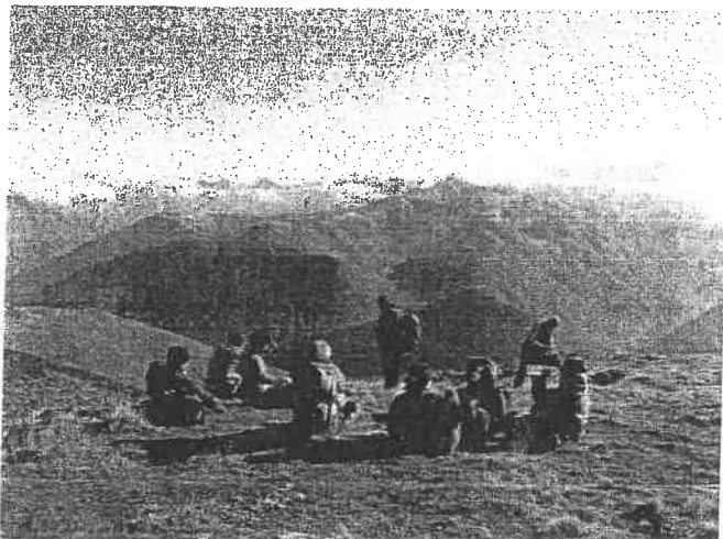
Sortie week-end en gîte pour Randoval. Vue sur les Pyrénées.