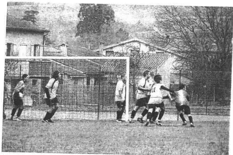
Notre équipe en plein effort contre Mézens