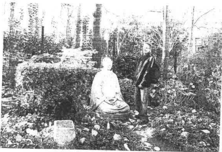
Visite au jardin japonais puis au marché de Noël de Toulouse