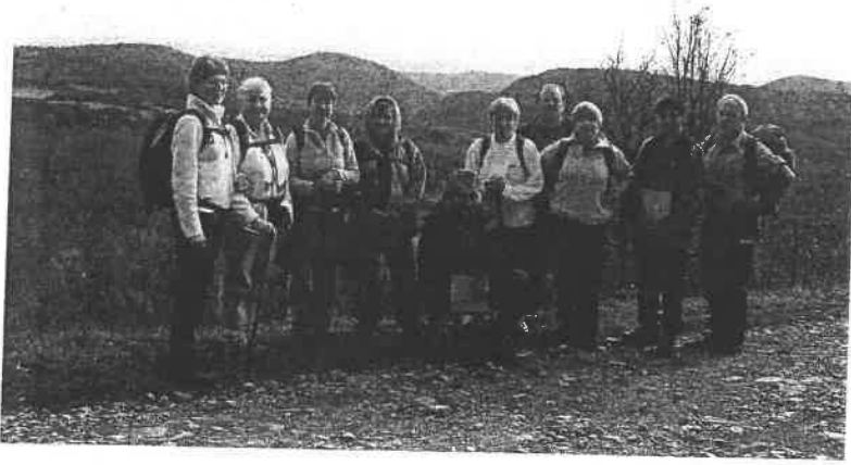
Ballade ensoleillée pour Randoval dans l'Hérault à Pardailhan.