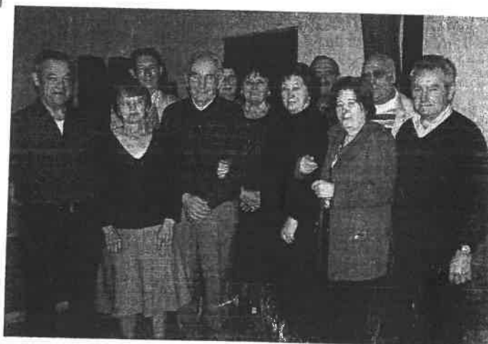
Un club des aînés très présents sur la commune.