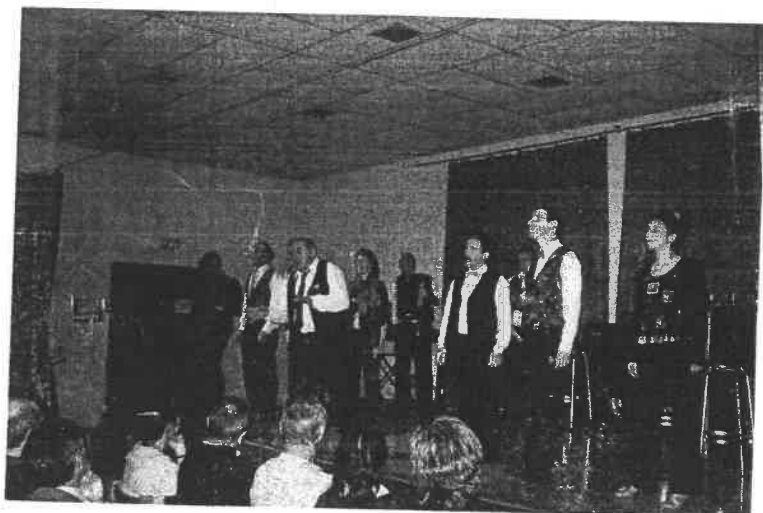
La compagnie du Jet d'eau avec son spectacle « les mots dits ».