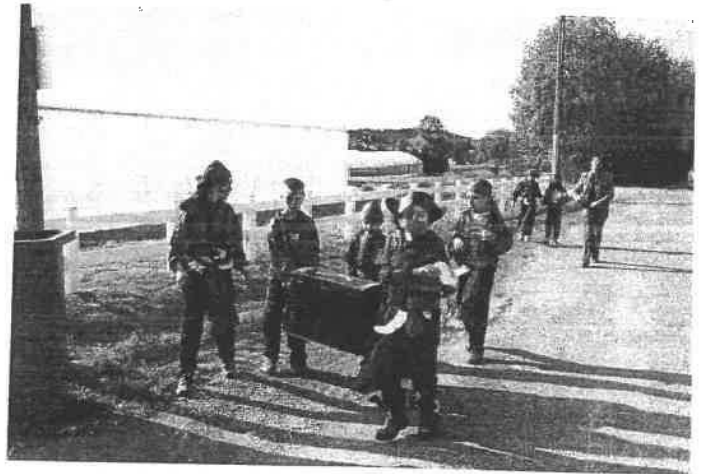
Club MJC, sortie d'octobre. Chasse au trésor dans les rues du village par une troupe de joyeux pirates.