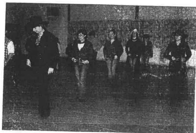
La danse country suscite un vif intérêt