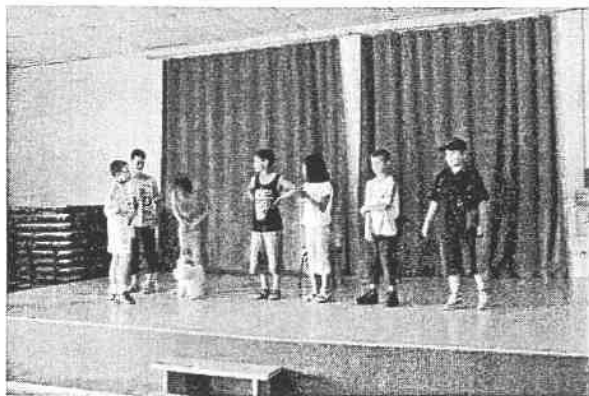
Représentation théâtre et danse country, voilà un échantillon de ce qui se fait à la MJC.