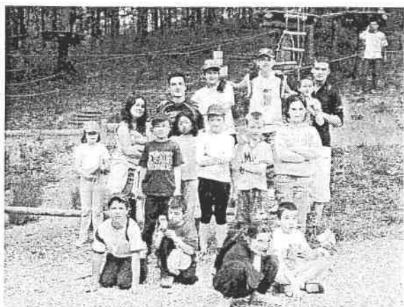
Sortie du club découverte au « cri de Tarzan »