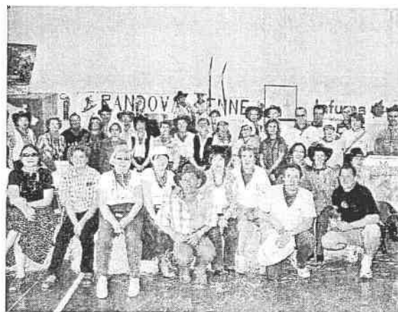
Toute l'équipe des bénévoles encadrant la 3 ème Randovalienne