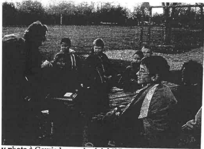
photo à Gourjade pour le club MJC