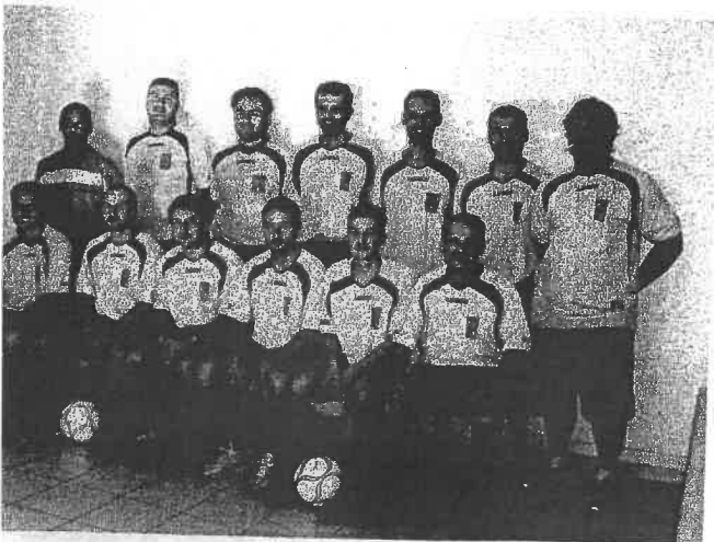
Une équipe de foot plein d'entrain et de dynamisme