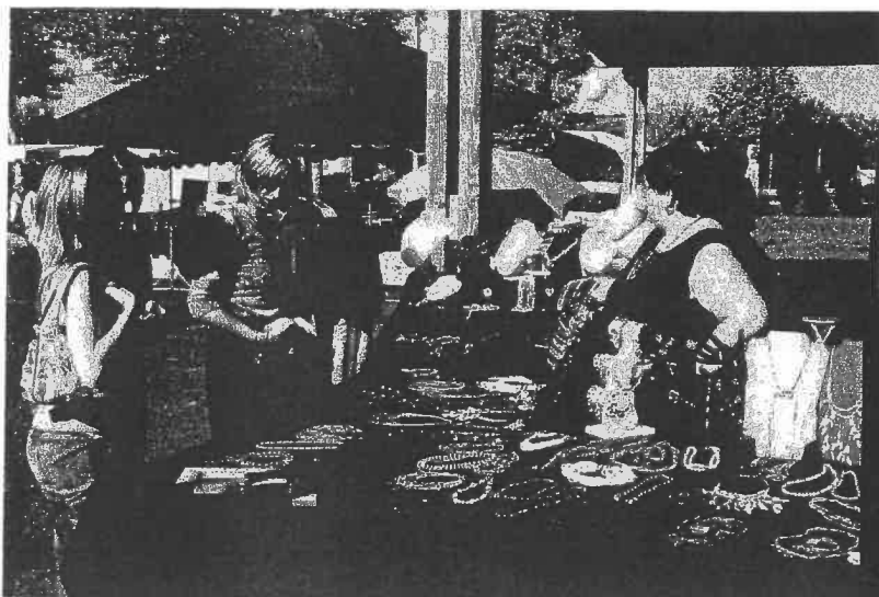
Marché artisanal du 9 octobre