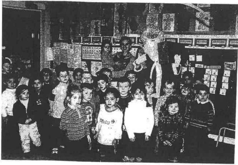
vendredi, le père Noël est arrivé les bras pleins de cadeaux.