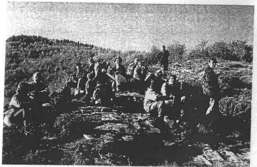
Randoval sur les hauteurs du Gijounet.