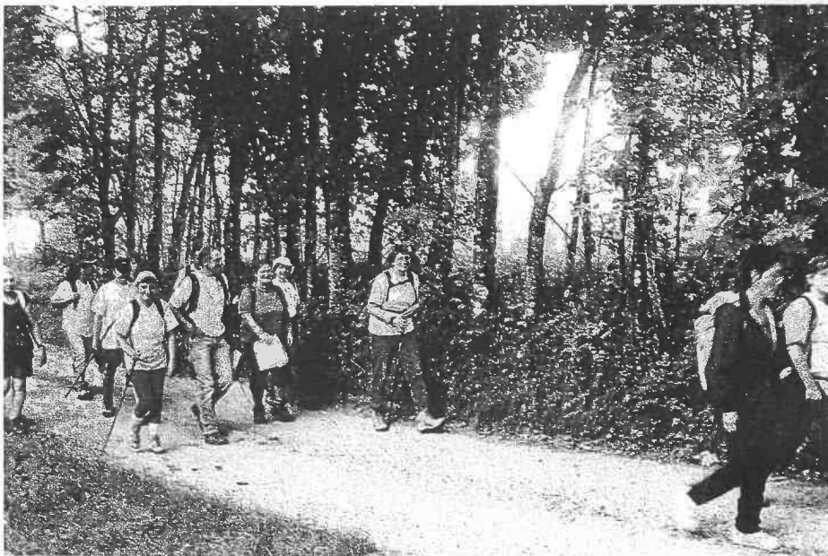
Toujours partant pour plus de ballades, Randoval suit son chemin sur les sentiers du Tam.