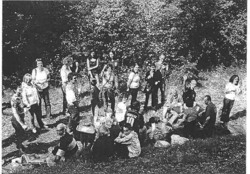
Repas champêtre après la visite du viaduc.