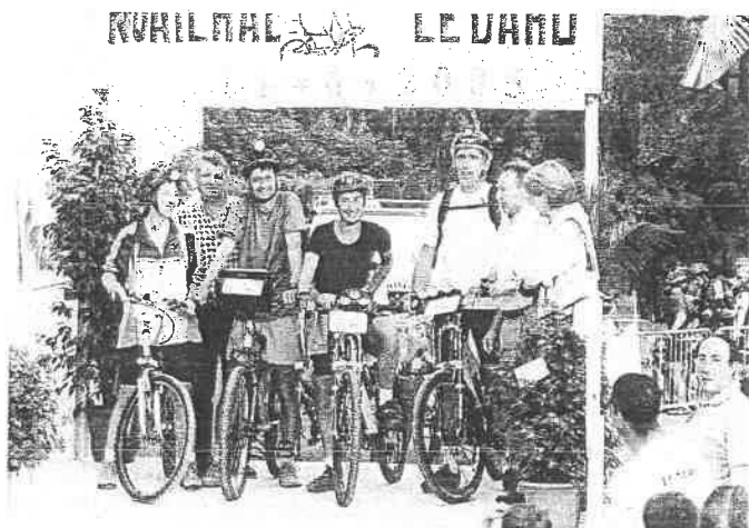
Au départ du Dahu à gauche du podium, des VTTistes, en harmonie avec les marcheurs, partant à droite.