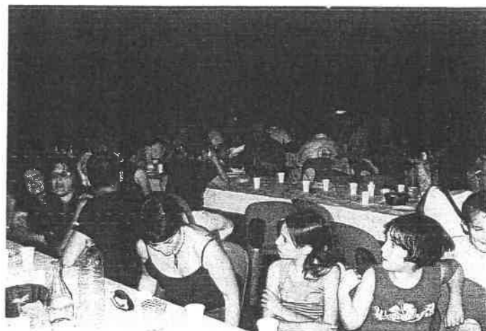
Repas lunch organisé pour clôturer les trois jours de fêtes de la MJC.