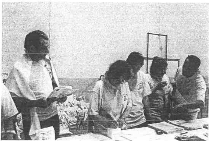
Toute l'équipe de Randoval s'active avant le grand rush., pour la Randovalienne.