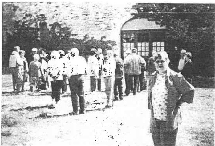
Sortie du club des aînés ruraux au musée de Cornus.