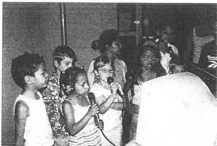
Ambiance karaoké pour les plus téméraires qui s'entraînent déjà pour les futurs concours...