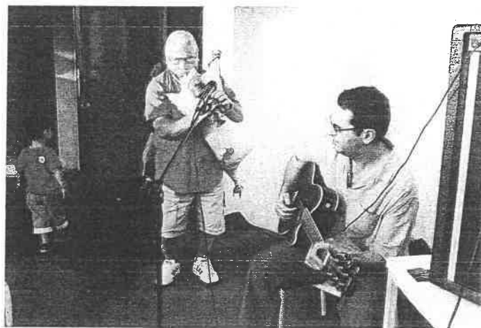
Il faut bien 2 poumons pour ce type d'instrument dont l'originalité en a surpris plus d'un., lors de la fête de l'école.