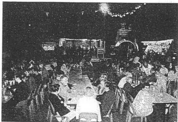
LA FABOUNADE DU SAMEDI SOIR