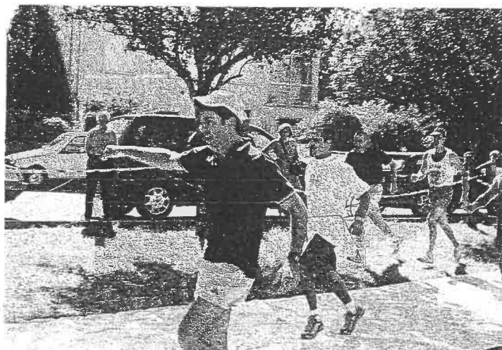
LA COURSE DU FIL ROUGE . JEUX INTER QUARTIERS

Les trois jours de festivités se sont déroulés les 20, 21 et 22 Août. Apéritif offert aux quelques privilégiés tels les sponsors, les membres de la mairie et tous les organisateurs de cette fête. Bal animé par un orchestre de musique plutôt disco, talentueux. Bonne ambiance malgré le peu d'engouement des danseurs.