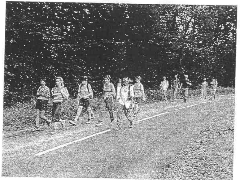
Sortie du 05 septembre aux Clairières de Sales.