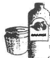
dots en verre et bocaux