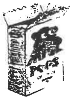
petits cartons plats