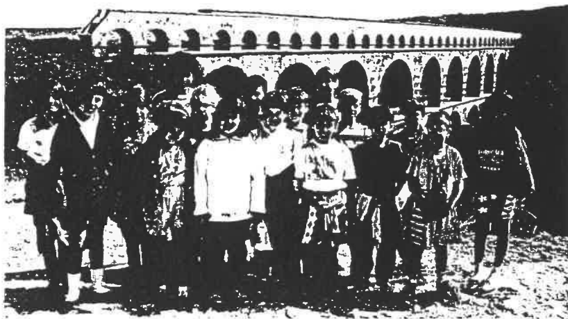
Les enfants du CE2 - CM1 - CM2 Devant le Pont du Gard