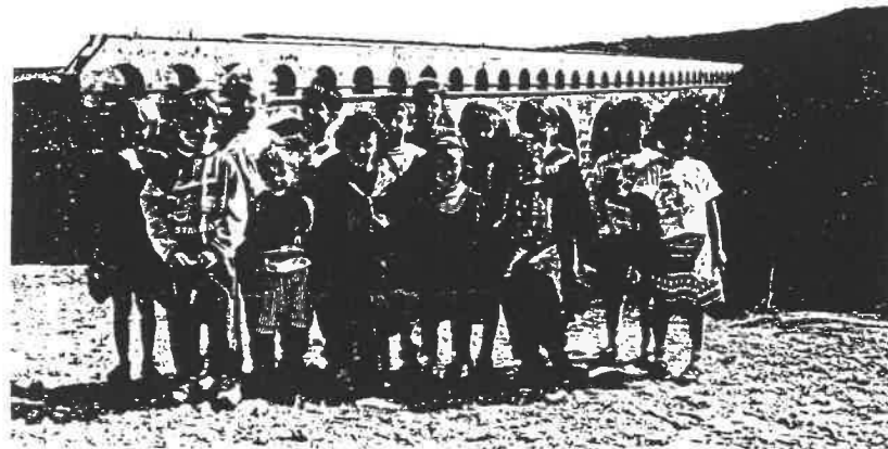
Les enfants du CP - CE