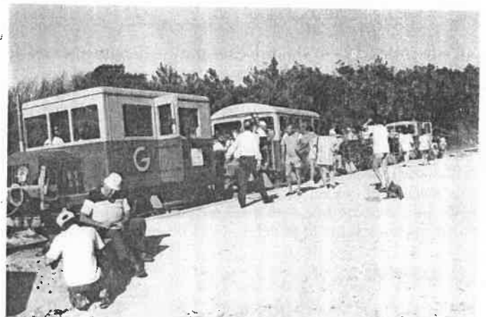
Le petit train touristique qui relie SOULAC à la POINTE DE GRAVE.

DIMANCHE 24 : Plage le matin. Ramassage de coquillages, d'étoiles de mer, d'algues puis identification. - Après-midi : baignade aux piscines. - Promenade dans le petit train qui relie à petite vitesse SOULAC à la POINTE DE GRAVE. - Goûter à la POINTE DE GRAVE, vue magnifique sur ROYAN, phare de CORDOUAN et terminal pétrolier du VERDON.