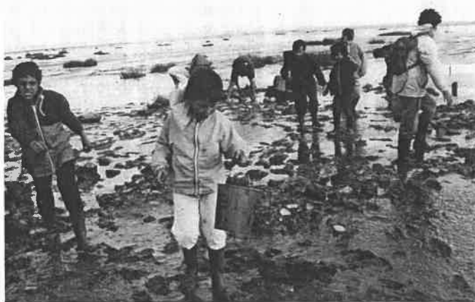
A la pêche aux crabes. Nous patageons dans la boue. Quel régal ! Les crabes sont surtout effrayés par les cris.