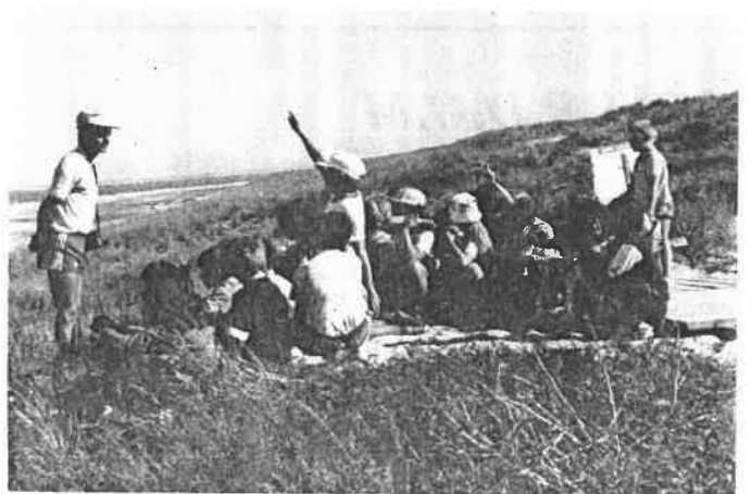
Une leçon sur la dune.

Après-midi : Pointe de Grave. - Visite du phare. - Table d'orientation.