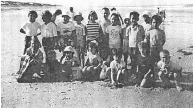
Les deux classes sur la plage océane.

- Pique-nique sur une aire de l'autoroute. - Arrêt à PAUL-LAC au coeur du Médoc : découverte de l'estuaire de la Gironde. - Arrivée à SOULAC au Camp des M.J.C du Tarn vers 17 H. - Découverte de l'océan pour plus de la moitié des élèves. - Installation dans les chambres. - Repas. - Courte veillée (Jeux de société).