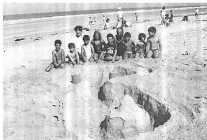
Ils ont gagné !!!

En soirée : Projection cassette du Zoo de la Palmyre.