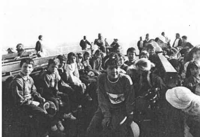
Sur le bac au milieu de l'estuaire de la GIRONDE.

Magnifiques spectacles d'otaries et de perroquets. Pique-nique à l'intérieur du zoo. Le soir, projection d'un dessin animé : Robin des Bois.