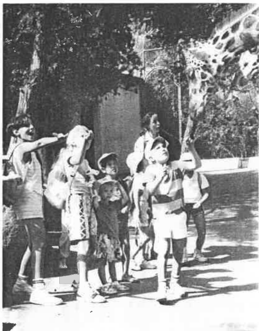
A la PALMYRE, les girafes ont toujours faim.