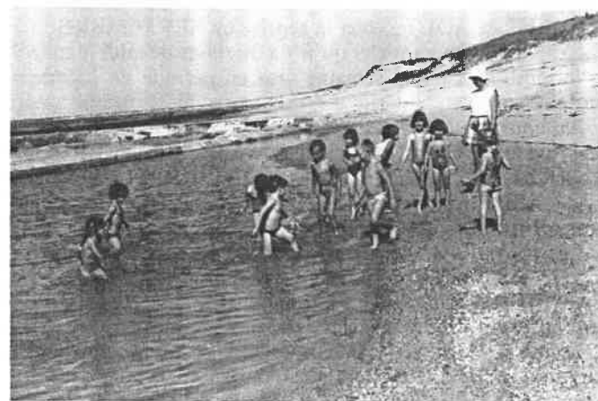
Baignade aux piscines.