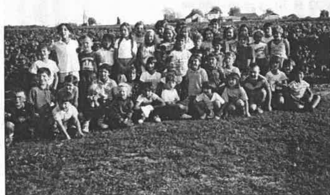
A BEGADAN, dans le Médoc, au milieu des vignes.

Après-midi : Visite de la Cave coopérative de BEGADAN dans le Médoc en période de vendanges. Sortie vélo pour un groupe. Veillée : Jeux animés par les adultes.