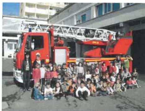
La relève chez les pompiers est assurée !