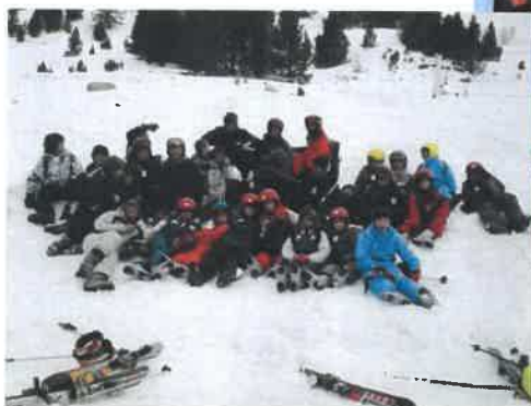
Le séjour ski proposé aux jeunes des 3 communes.