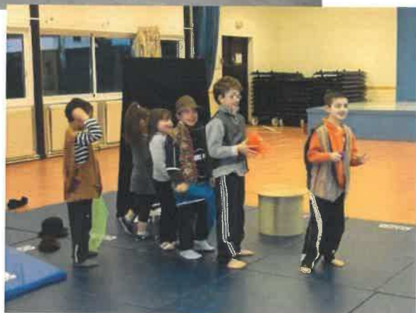
Les enfants de la MJC font leur cirque !...