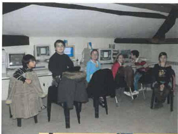
Le cours d'informatique et des élèves très éveillés.