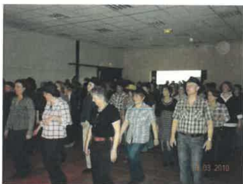
Soirée country du 13 mars organisée par les « Spirit of the O.C. »