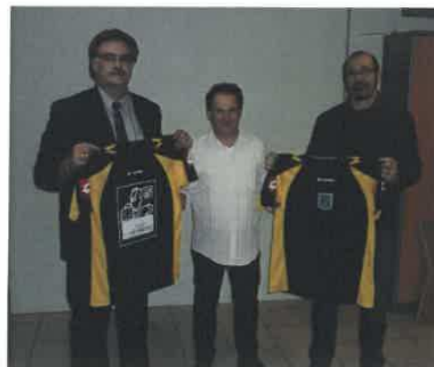
De nouveaux maillots pour nos équipes de football.