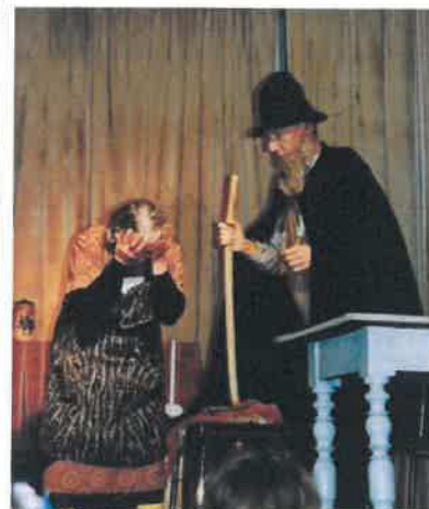
Encore du théâtre avec la troupe d'Augmontel. Soirée organisée par les Aînés ruraux